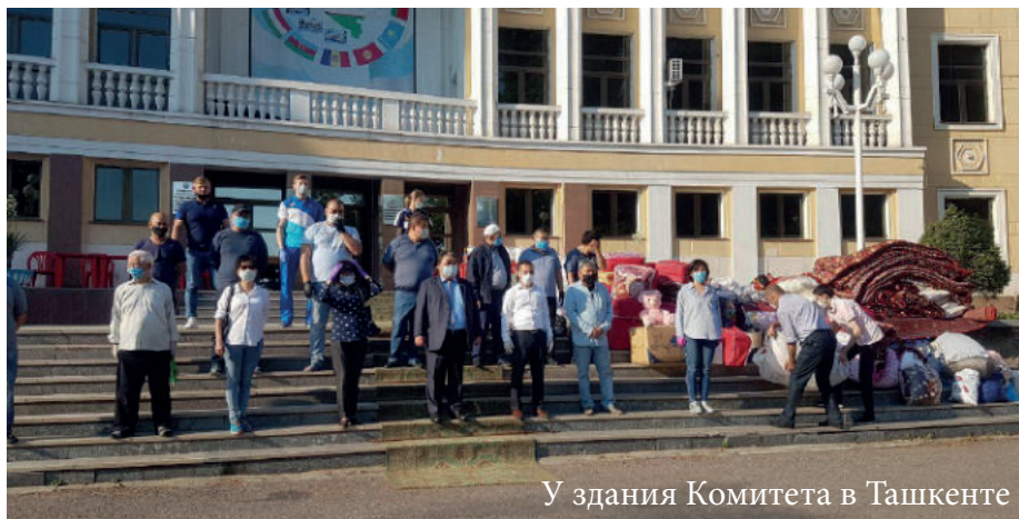
У здания Комитета в Ташкенте

Призыв оказать помощь пострадавшим в результате ЧС на Сардо-