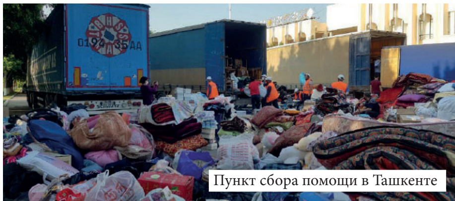
Пункт сбора помощи в Ташкенте