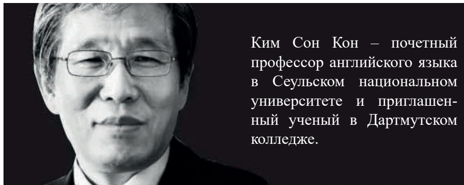
Ким Сон Кюн – почетный профессор английского языка в Сеульском национальном университете и приглашенный ученый в Дартмутском колледже.

ладать, те страны, которые обеспечивали иностранным компаниям дешевый труд, неизбежно получат самый тяжелый удар. Пострадают также государства, экономика которых зависит от международной торговли, поскольку многие страны на некоторое время сократят импорт. Поэтому после пандемии немало стран столкнутся с беспрецедент-